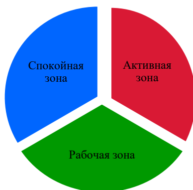
Модель № 1 «Построение развивающей предметно-пространственной среды»

Модель № 1 отражает идею разной степени активности детей. В групповых помещениях выделены спокойная, активная и рабочая зоны. Такое распределение позволяет создать благоприятную обстановку для сосредоточенной деятельности, способствует освоению детьми общепринятых культурных норм, этики поведения. Кроме того, представленная модель иллюстрирует организацию непересекающихся сфер самостоятельной детской активности внутри