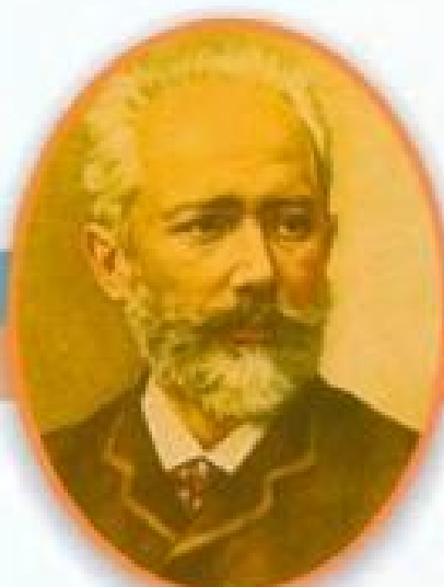
Петр Ильич Чайковский Великий русский композитор