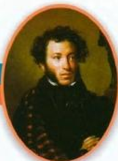
Александр Сергеевич Пушкин Великий русский поэт