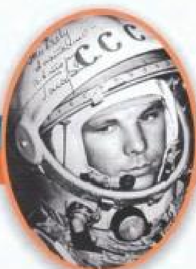
Юрий Алексеевич Гагарин Первый космонавт