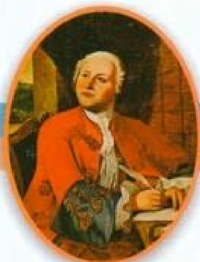
Михаил Васильевич Ломоносов Великий русский ученый

Ты, конечно же, вспомнишь, что Александр Сергеевич Пушкин написал много прекрасных стихов и чудесные сказки: «Сказка о царе Салтане», «Сказка о рыбаке и рыбке», «Сказка о мертвой царевне и о семи богатырях», «Сказка о золотом петушке». Петр Ильич Чайковский писал необыкновенно красивую музыку, создал цикл пьес «Времена года» и хорошо знакомый тебе «Детский альбом». Михаил Васильевич Ломоносов — великий русский ученый, он многого добился в самых разных областях знаний: литературе и искусстве, физике и астрономии, географии и истории. Им сделано много важных научных открытий. Юрий Алексеевич Гагарин был первым космонавтом, первым человеком, облетевшим на космическом корабле «Восток-1» нашу планету.